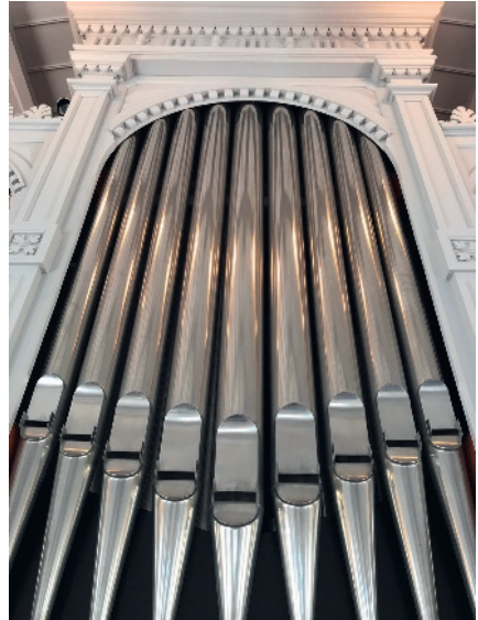
Orgelpfeifen wie diese sorgen für den einmaligen Klang des Instruments.

Erstmals kommt es bei der Mitgliederversammlung 2014 zu einer Satzungsänderung, die einstimmig angenommen wird: Es geht dabei um die Streichung einer Bestimmung in Paragraf 7 Absatz 1, Satz 2: Der Hinweis darauf, dass mindestens ein Mitglied des Vorstands zugleich Mitglied des Presbyteriums sein muss, entfällt.