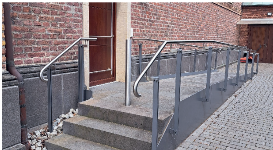
Der barrierefreie Zugang zur Altstadtkirche, der 2016 geschaffen wurde.

Zwei Jahre nach Abschluss der Arbeiten an der Altstadtkirche ist auch der Vorplatz mit Kradepohl, neu gestaltet. Ein Fest rund um Altstadtkirche und Kradepohl findet – unter aktiver Beteiligung des Fördervereins – Ende Mai 2018 statt.