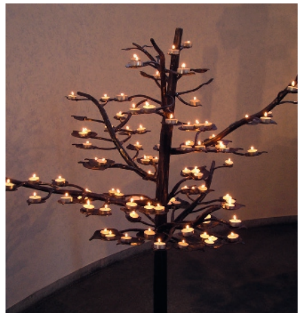
Diesen Kerzenbaum gab der Förderverein 2008 in einer Krefelder Werkstatt in Auftrag.

Vier Monate nach der Wiedereröffnung der Altstadtkirche gibt es bei der Mitgliederversammlung 2017 positive, vereinzelt auch negative Kommentare der Vereinsmitglieder zur Neugestaltung des Kirchrums.