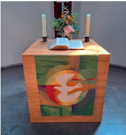
Die dem Kirchenjahr angepassten Antependien erwarb der Förderverein für die Kirche

Ohne die verschiedenen Geldquellen wäre die Arbeit und die finanzielle Unterstützung, die der Förderverein laut seines Kassenberichts Jahr für Jahr aufbringt, nicht möglich – erst recht nicht im vier-, zuweilen gar im fünfstelligen Bereich. Es ist zwar richtig, dass die Evangelische Kirchengemeinde Monheim nach entsprechender Absprache die Vorfinanzierung eines größeren (= teureren) Projekts übernimmt, der Vorstand des Fördervereins aber alles daran setzt, seine „Schulden“ bei der Kirchengemeinde so schnell wie möglich („nach Kassenlage“) zu tilgen.