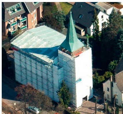
2016 war die Altstadtkirche für die umfangreichen Restaurierungs- und Umbauarbeit über mehrere Monate komplett eingehaust.

Der Verein hat die Restaurierung der Altarbibel, die zur Errichtung der Kirchengemeinde 1839 als Geschenk des rheinischen Konsistoriums übergeben wurde, bei den Werkstätten des Landschaftsverbandes Rheinland, Abteilung Abtei Brauweiler, in Auftrag gegeben. Der Vorstand übergibt die Bibel nach Abschluss der Arbeiten in einem Gottesdienst in der Altstadtkirche am 1. Advent 2023.