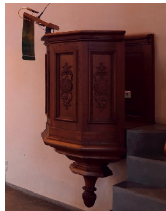
Die alten Prinzipalstücke - Altar und Lesepult (links) sowie die erhöht an der Wand befestigte Kanzel.