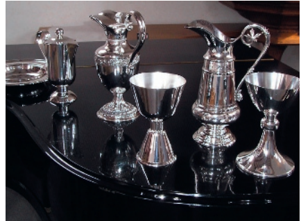
Das Abendmahlsgeschirr mit Kanne und Taufschale.

Deutlich mehr als 100.000 Euro wurden zwischen 2004 und 2023 zum Erhalt und zur Verschönerung der Altstadtkirche ausgegeben. Was der Förderverein in den 20 Jahren seines Bestehens finanziert hat, ergibt eine stolze (und lange) Liste; hier eine kleine Auswahl geförderter Projekte: