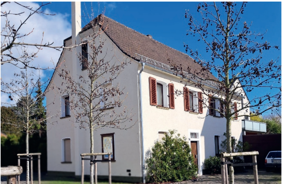
Die alte evangelische Schule, erbaut im Jahr 1786, ist heute als „Küsterhaus“ bekannt.

Dann ist für mehr als 200 Jahre in den Quellen von einem evangelischen kirchlichen Leben in Monheim und Baumberg nicht mehr die Rede. 1786 errichten die Evangelischen zuerst eine Schule, deren Bau noch heute existiert – als das so genannte „Küsterhaus“ neben der Kirche. Damit ist zwar etwas für die Unterweisung