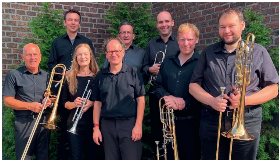
Der Bläserkreis der Evangelischen Kirchengemeinde Monheim vor einem Konzert.