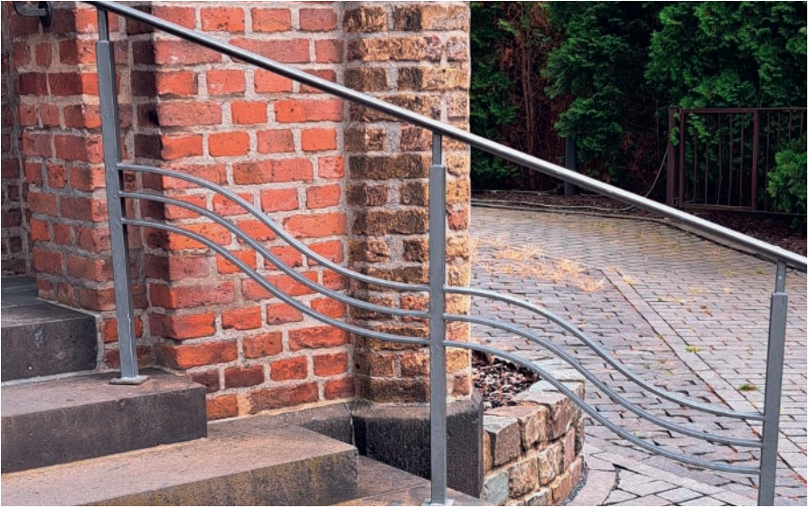
Der Handlauf am Haupteingang der Altstadtkirche.