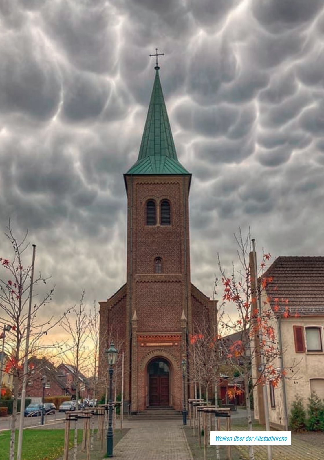
Wolken über der Altstadtkirche